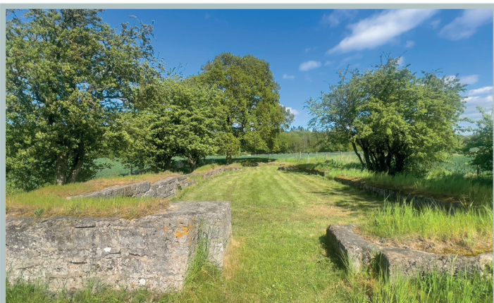
Knud Lavards Kapel

Følg vejen til Valsømagle og videre ud til hovedvej 14, hvor der drejes til højre mod Ringsted.