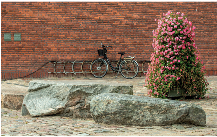
Tingsten foran Rådhuset

Turen udgår fra Torvet. På Torvet foran Rådhuset ses de 3 tingsten, der markerer det gamle Sjællandsfar Landsting. Her afgjordes stridigheder, og konger lod sig vælge. I 1584 flyttede man landstinget ind i kirkens nordlige korsarm, og i 1805 flyttede man endelig landstinget til København som Østre Landsret. Den sidste konge, der blev kronet her, var Chr. IV.