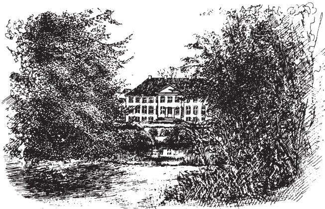
Skjoldenæsholm fra parken