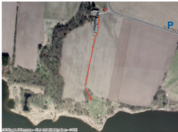
Adgangssti til Ridebanen og Voldstedet. Voldstedet nås ved at følge trampestierne i kanten af Haraldsted sø. Parker i vejrabatten langs Valsømaglevej.

Dette projekt er gennemført med støtte fra Det Europæiske Fællesskab og Ministeriet for Fødevarer, Landbrug og Fiskeri, NaturErhvervstyrelsen.