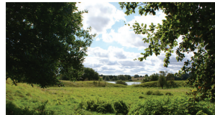
Den ene af åbningerne i jordvoldene mod Haraldsted Sø.

Det har ikke været muligt at eftervise, om teorien om et religiøst anlæg er forklaringen på stedets formgivning.