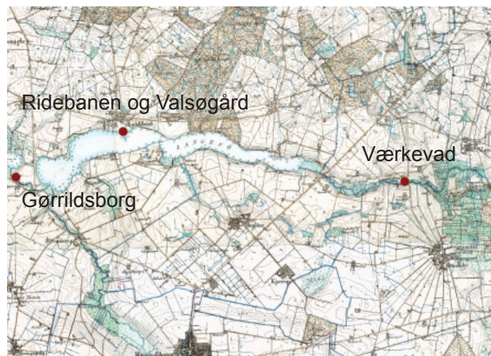
Beliggenheden af Voldstederne og vadestedet ved Værkevad. Historisk kort 1842 - 1888

Adgangen ind bag voldene foregik ad en hulvej, som sikkert har været forstærket af kampesten og skjult for omverdenen af tæt skov. Også fra søsiden har man kunnet komme ind bag voldene, sikkert igennem et palisadeværn.